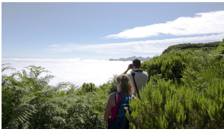
Figura 1 - Fatores desencadeantes de Acidentes nos Percursos Pedestres (Nevoeiro)

extensa área sem vias de comunicação, não obstante, a boa sinalização e informação sobre os percursos (Neves, et al., 2010).