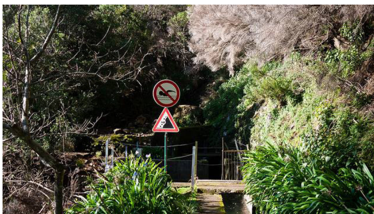
Figura 2 - Sinalização de Condições Perigosas

Existem, também, nas áreas em estudo, factores naturais que propiciam a ocorrência de quedas. A paisagem é marcada pelo acidentado do relevo em que as vertentes são, habitualmente, juncadas de cascalheiras e blocos de diferentes dimensões. Assim, especialmente fora dos caminhos e trilhos marcados, o terreno é bastante irregular, declivoso e juncado de pedras soltas. A ocorrência de chuva e o aumento de humidade junto aos cursos de água tornam os fragmentos de rocha ainda mais escorregadios. A visibilidade reduzida resultante das condições atmosféricas ou da ausência de luz solar bem como a realização de caminhadas em trilhos bastante irregulares, facilita, também a ocorrência de quedas, que ocorrem com frequência, também, quando da realização de actividades de aventura. O acesso a pontos de água para lazer (Fig. 2) faz-se, em muitas áreas, pelo meio da vegetação, em locais bastante acidentados e de piso irregular, o que concorre para o mesmo efeito (Neves, et al., 2010).