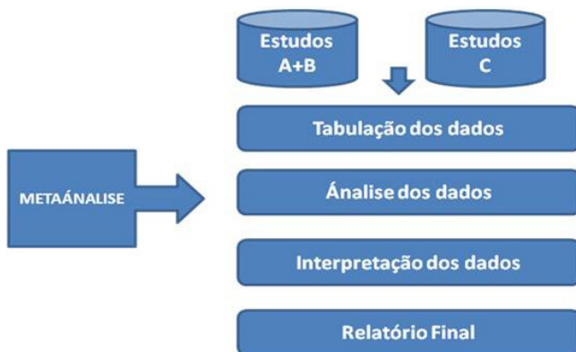
Fig. 1-Seqüência de análise dos dados realizada.

Foram utilizados revisões bibliográficas de marcadores epidemiológicos em vários países através de metaanálise e observada a sua importância estatística quando comparada com dados obtidos em Portugal. A Fig. 1 mostra a seqüência da análise dos dados considerada significativa devido ao valor de odds ratio estar acima de 1.