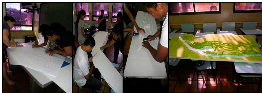
Figura 4: Construção da maquete das áreas de risco da cidade de Aquidauana

Para recortar as curvas, foi utilizado cortador de isopor e em seguida, realizou-se a sobreposição e colagem das placas, iniciando-se pela cota mais baixa. Para dar a ideia da continuidade do relevo, os intervalos entre as diferença de degraus das placas foram preenchidos com massa