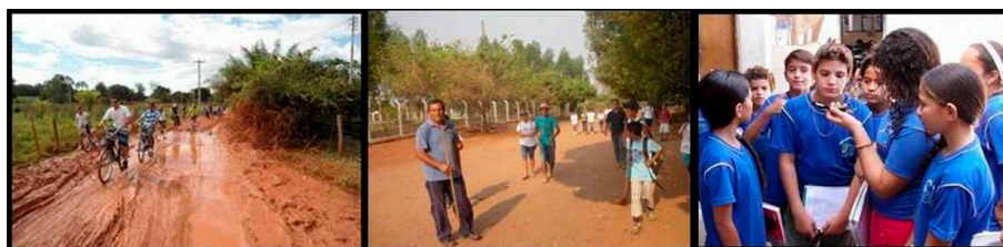
Figura 2. Reconhecimento da área

Buscando refletir sobre ações que potencializam os impactos negativos no espaço estudado, clamando a responsabilidade social e quebrar a hegemonia predominante, experiência vivenciada por acadêmicos, alunos, professores da rede pública de ensino no Curso de graduação em Geografia na cidade de Aquidauana instigou a compreensão dos participantes como sujeitos ativos, percebendo sua inserção nos diferentes espaços, possibilitando reivindicações de prioridade essencial na implementação das políticas públicas, fator de preservação da ética humana e de coesão social com o ambiente de vivência cotidiana. Num primeiro momento acadêmicos fizeram um reconhecimento, reflexão sobre o espaço vulnerável ao risco. Depois com auxílio do professor e dos alunos caminharam, refletiram e cartografaram o chão com posterior representação tridimensional da área.